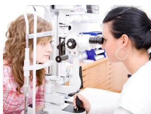
Vragen en adviezen