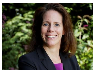
Voorwoord van de voorzitter