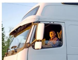
Onderzoek en aanbevelingen