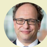
Wouter Koolmees minister van Sociale Zaken en Werkgelegenheid

Het 70-jarig bestaan van de SER kent veel memorabele mijlpalen. Zoals het Pensioenakkoord van 2019. Dit was het sluitstuk van tien jaar onderhandelingen over de vernieuwing van het Nederlandse pensioenstelsel, dat bekendstaat als een van de meest solide ter wereld. Minister Wouter Koolmees (Sociale Zaken en Werkgelegenheid) zat de laatste jaren aan de onderhandelingstafel.