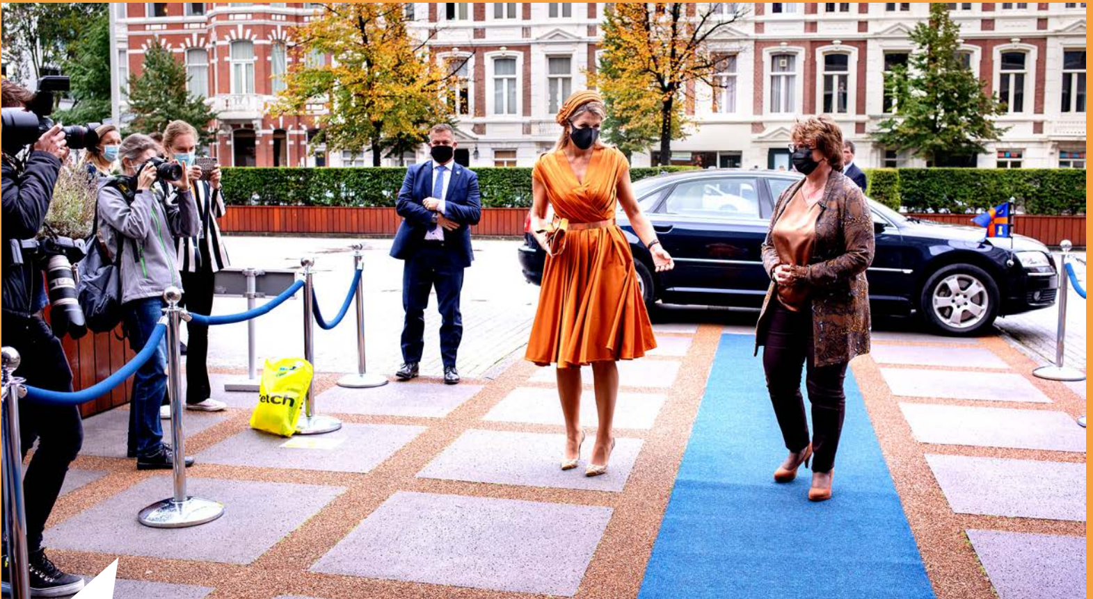
SER-voorzitter Mariëtte Hamer: "We zijn zeer vereerd dat we koningin Máxima hebben mogen ontvangen ter ere van ons 70-jarig bestaan. Zij heeft altijd veel belangstelling voor sociaaleconomische kwesties in Nederland en daarom is het extra fijn dat ze aanwezig kan zijn."