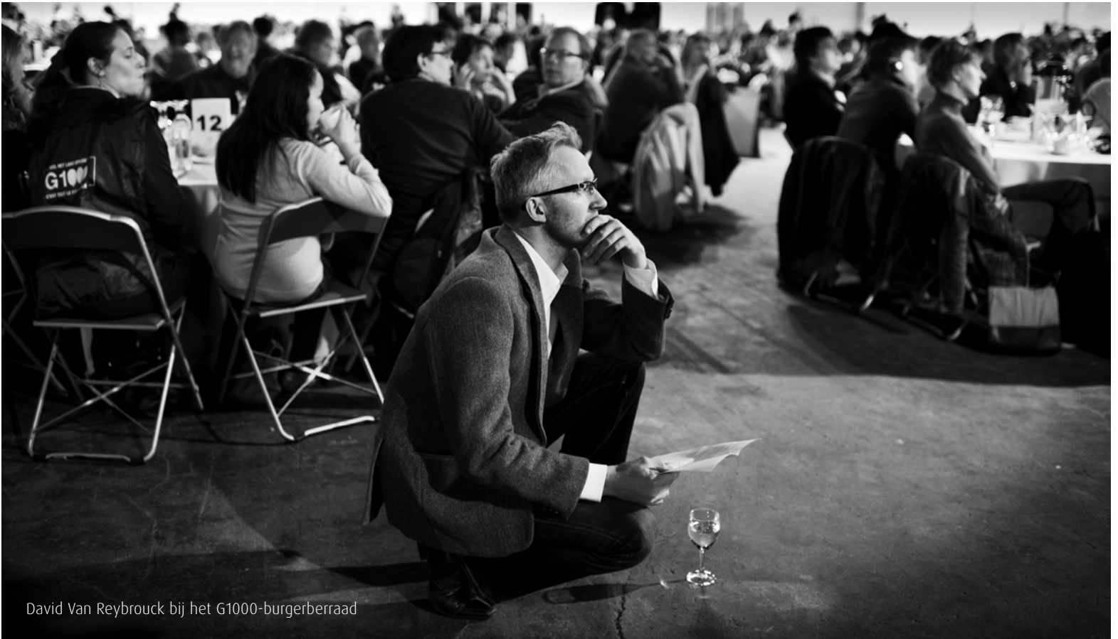
David Van Reybrouck bij het G1000-burgerberaad