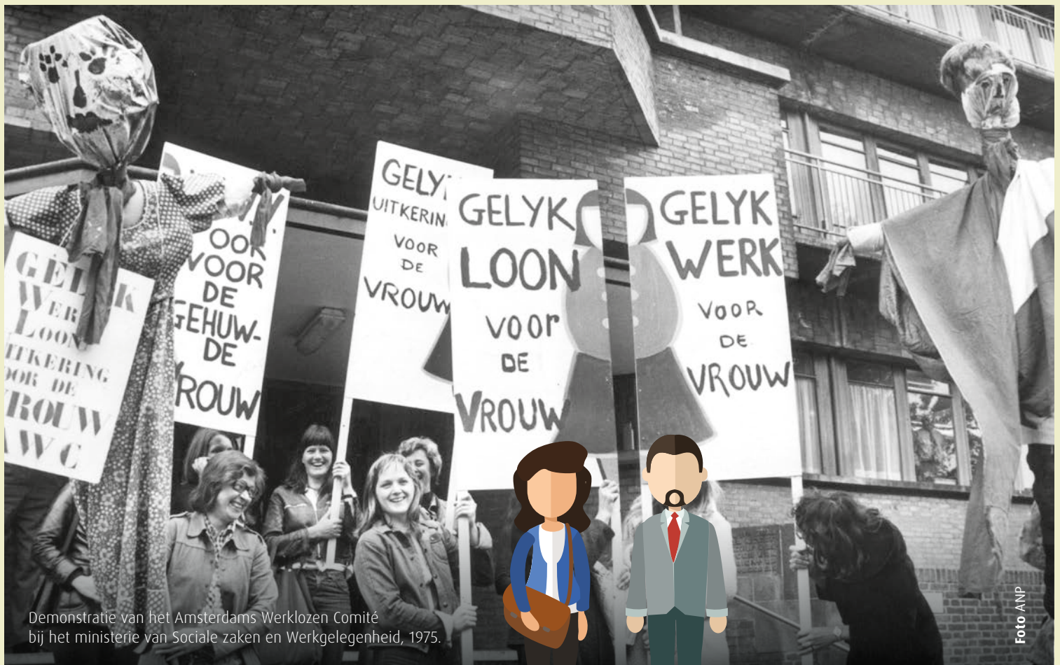
Demonstratie van het Amsterdams Werklozen Comité bij het ministerie van Sociale zaken en Werkgelegenheid, 1975.