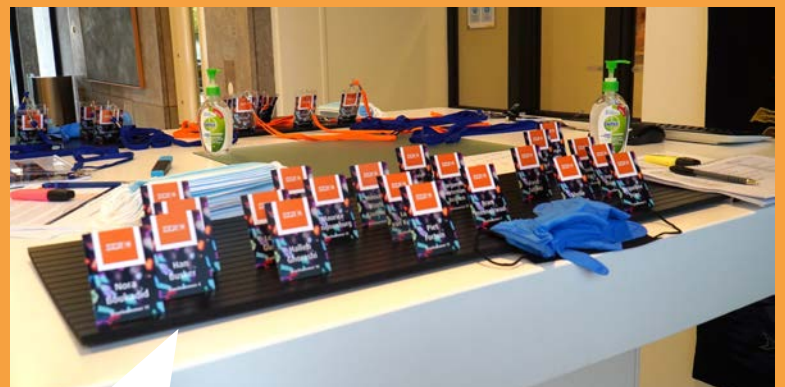
Naast de 25 deelnemers in de tot tv-studio omgetoverde raadzaal van de SER volgen ook ruim 750 mensen de livestream.