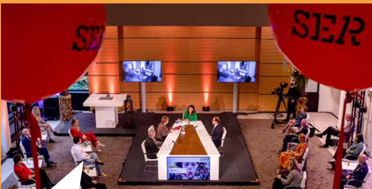
Op 1 oktober hebben we 70 jaar SER gevierd met een inspirerend online congres. Vertegenwoordigers van werkgevers, werknemers, overheid en wetenschap spreken over de rol van de SER en de overleconomie in een veranderende samenleving.