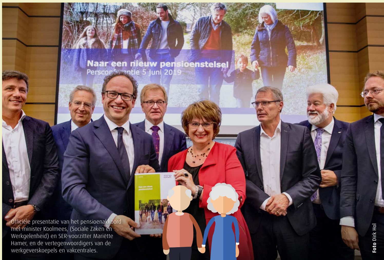
Officiële presentatie van het pensioenakkoord met minister Koolmees, (Sociale Zaken en Werkgelegenheid) en SER-voorzitter Mariëtte Hamer, en de vertegenwoordigers van de werkgeverskoepels en vakcentrales.

In het nieuwe stelsel hoeven pensioenfondsen minder grote buffers aan te houden, waardoor deelnemers eerder zicht hebben op een koopkrachtig pensioen. Om te heftige schommelingen in de uitkeringen tegen te gaan, zijn diverse 'schokdempers' ingebouwd. Het pensioenakkoord wordt momenteel uitgewerkt in wetgeving, die in 2026 in werking moet treden.