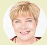
Kitty Jong vicevoorzitter FNV

Het 70-jarig bestaan van de SER kent veel memorabele mijlpalen. In 1975 werd het wettelijk verboden om mannen en vrouwen voor gelijkwaardig werk niet gelijk te betalen. Deze wet volgde op een advies van de SER. Een belangrijk moment voor Nederland, maar volgens Kitty Jong, vicevoorzitter van de FNV, is het probleem nog steeds niet opgelost.