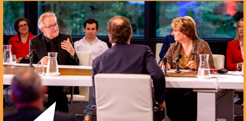
Schrijver David Van Reybrouck pleit voor een burgerpanel van alle maatschappelijke niveaus, gestoeld op Frans model. "Burgers zijn niet gebonden aan partijen of belangen en daardoor kunnen ze goed de geïndividualiseerde samenleving vertegenwoordigen."