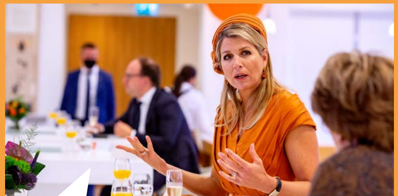
Na afloop van het congres spreekt koningin Máxima met een aantal deelnemers door over diversiteit, duurzaamheid en jongeren.