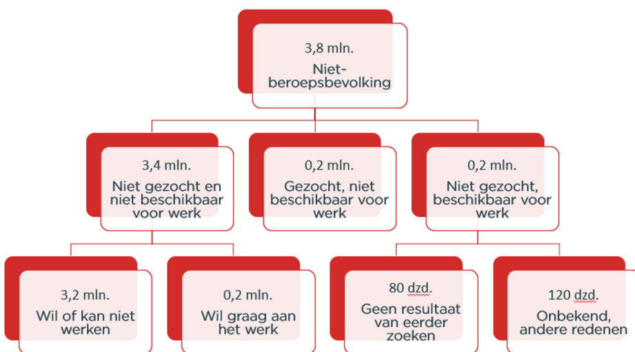
Figuur 2 Samenstelling niet-beroepsbevolking

De arbeidsparticipatie in Nederland ligt op een hoog niveau. Toch zijn er genoeg mensen die niet werken of langer door willen werken (zie figuur 2). 42 Nader inzicht is nodig in deze groepen en hun competenties en de belemmeringen die zij ervaren om in deze krappe arbeidsmarkt te participeren.