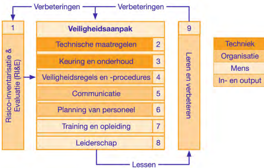
Figuur 2 Onze systematische veiligheidsaanpak

Deze drie typen maatregelen vormen samen een systematiek: de veiligheidsaanpak. Wat maakt de veiligheidsaanpak systematisch? Doordat je (1) maatregelen systematisch kiest en (2) systematisch verbetert. Zie ook Figuur 2.